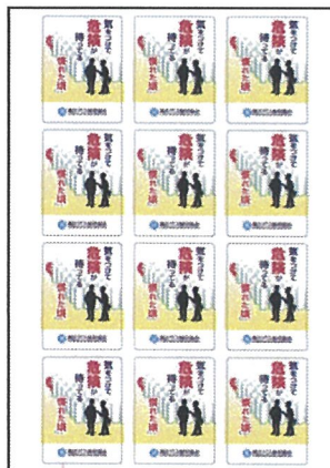
No.10 セーフティシールB