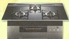
Siセンサーコンロ (ビルトインコンロ)