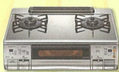
Siセンサーコンロ (テーブルコンロ)